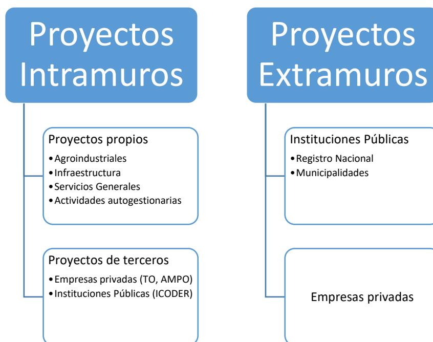
Figura 2.1: Tipología de proyectos de trabajo penitenciario

Como se puede observar en la figura precedente, los proyectos en centros cerrados pueden ser gestionados directamente por el sistema penitenciario o por terceros. En la categoría de los proyectos propios del sistema destacan los desarrollados por el Departamento Industrial y Agropecuario de la Dirección General de Adaptación Social y los del Departamento de Servicios Generales; también existe una proporción importante de personas privadas de libertad que realizan actividades productivas por cuenta propia, conocidas como “actividad autogestionaria”; mientras tanto, entre los proyectos de terceros destacan el gestionado por la Fundación TO en el CAI Jorge Debravo y el de la Empresa AMPO en el Vilma Curling.